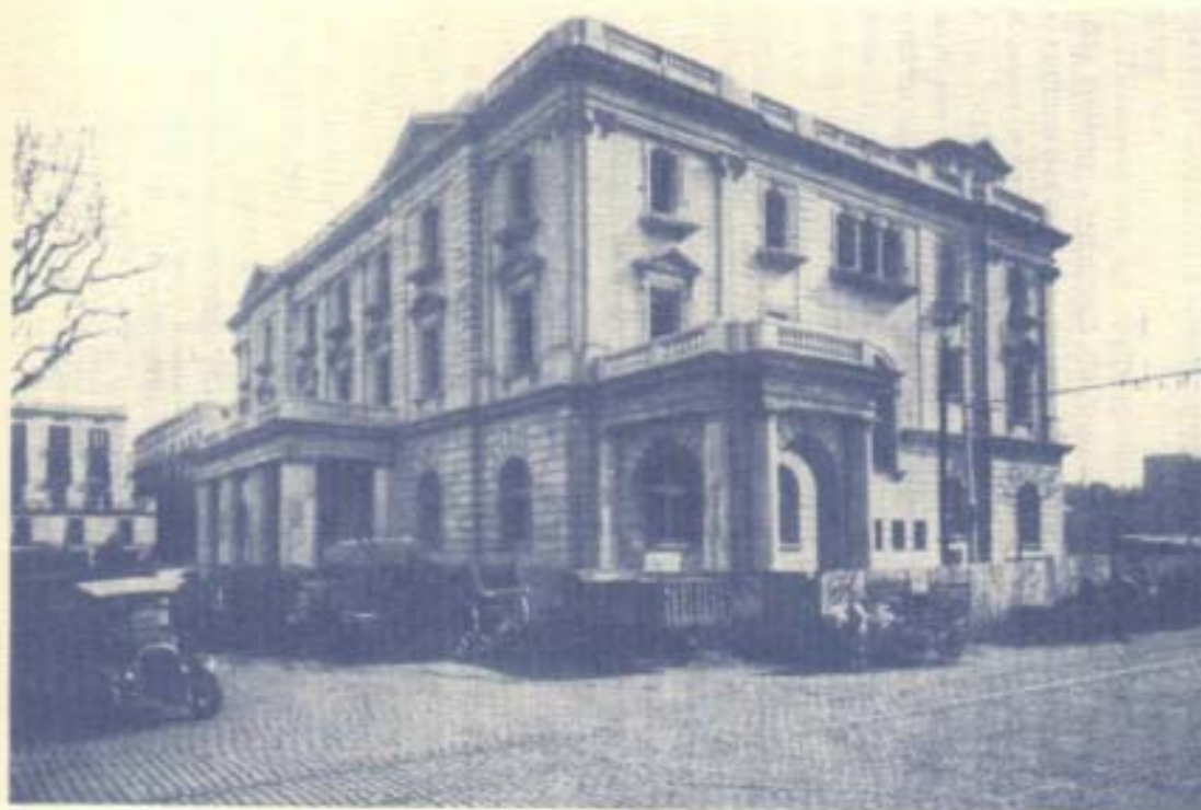
INSTITUT NÀUTIC DE LA NEOTRUAKIA : Vista de les obres de l'edifici, 15 febrer 1932

M'agradaria haver sabut transmetre els paral·lelismes entre aquestes emblemàtiques institucions, coincidències que he tingut sempre presents en escriure aquesta intervenció, alhora que els desitjo un curs ben profitós, en el transcurs del qual espero que tinguem l'oportunitat de col·laborar.